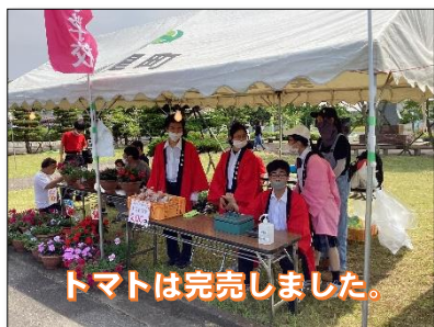
トマトは完売しました。

6月10日(土)・11日(日)の2日間、美里町南郷庁舎付近を会場に開催されました。今年は例年どおりの開催内容ということで、本校からも農産物の販売ブース設置と軽音楽部が参加しました。トマトの販売もあっという間に完売。ステージ発表も生徒・卒業生・本校職員により、まぶしい太陽の下で大いに盛り上がりを見せました。