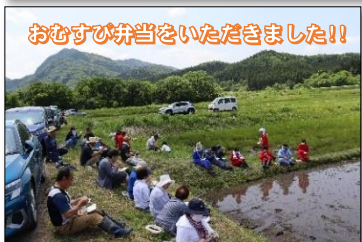
おむすび弁当をいただきました!!