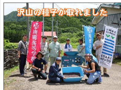
沢山の種子が取れました