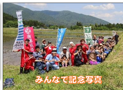
みんなで記念写真