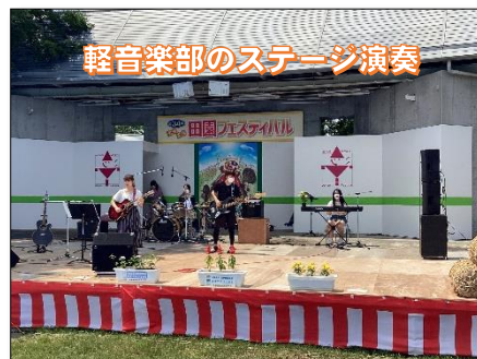
軽音楽部のステージ演奏

6月10日(土)・11日(日)の2日間、美里町南郷庁舎付近を会場に開催されました。今年は例年どおりの開催内容ということで、本校からも農産物の販売ブース設置と軽音楽部が参加しました。トマトの販売もあっという間に完売。ステージ発表も生徒・卒業生・本校職員により、まぶしい太陽の下で大いに盛り上がりを見せました。