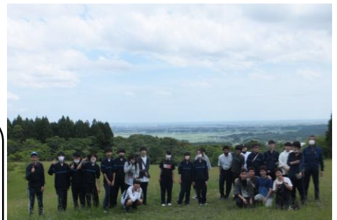
▲山頂から海が一望

PTAの皆さんが作ってくれる豚汁が食べられず残念でした。今年度は “おにぎり弁当”