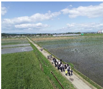
▲田植えを終えた水田を眺めながら 一路、旭山を目指して

雨天により1週間延期して実施しました。昨年度は臨時休校期間が長引き中止だったため、1年ぶりの旭山探検実施となりました。そのため、半数以上の生徒にとって、旭山までの道のり往復約16kmを歩くことは初めての経験でした。足にマメができたり、道を間違えたりする生徒もありましたが、予定終了時刻の午後3時までに全員が帰校しました。3年生は旭山山頂に登りましたが、晴天に恵まれ素晴らしい眺めだったようです。