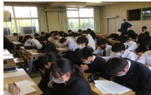
▲発表者と聴衆が一緒につくりあげる意見発表会