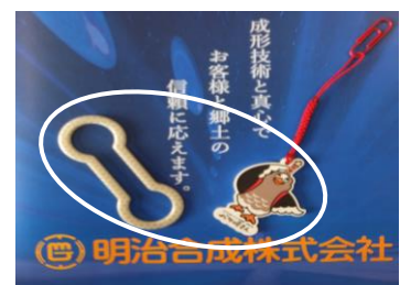
▲自社技術を活用した見学記念品に アイデアが形になる面白さを実感