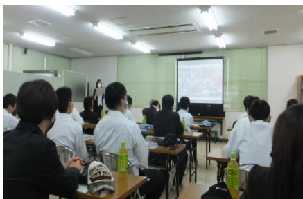
▲会社の概要説明後に各製造ブースの仕事を見学

見学企業は「明治合成株式会社」で、金型やプラスチック類の成形、プレス加工、塗装など精密な部品の製作を特化技術として持っていました。見学当日は、風雨が強く荒れた天気でした。生徒たちは緊張した面持ちで工場内に入り製作工程を見学しました。企業側の担当者から丁寧な説明を受け、普段見ることのできない工場の内部を見せていただきました。製作工程の中で電化製品や自動車等の「重要な部品」であることや国内・外などで広く流通・利用されていることも知ることができ、ものづくりの特殊性や機能性・流過程について深く学ぶことができました。